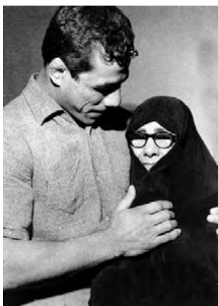
شکل ۱۵-۴- جهان پهلوان تختی

از روحانیان ممتاز می‌توان از مرحوم آیت‌الله طالقانی یاد کرد. او شکنجه‌های بسیاری در زندان طاغوت کشید و از یاران امام خمینی (ره) و اولین امام جمعه تهران پس از انقلاب بود. آیت‌الله طالقانی شاگردان بسیاری برای مبارزه با رژیم ستم‌شاهی تربیت کرد که شهید چمران یکی از کسانی بود که در مجالس درس ایشان شرکت می‌کرد.