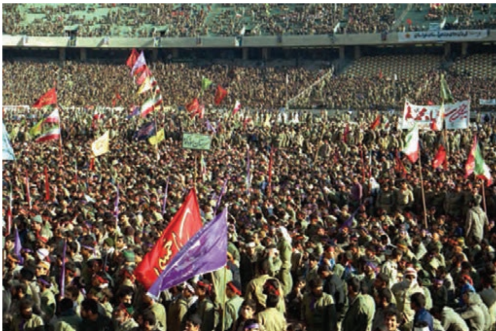
شکل ۷-۴- اعزام سراسری یکصد هزار نفری سپاه حضرت محمد (ص) از شهر تهران

شهر تهران به دلیل مرکزیت سیاسی، نقش بسیار ارزشمندی در دفاع از کیان اسلامی در دوران هشت سال دفاع مقدس بر عهده داشت. استان تهران اگرچه از نظر جغرافیایی دور از مرزها به سر می برد، ولی به واسطه پایتخت بودن و پشتیبانی خطوط جبهه، تقریباً مانند شهرهای مرزی مورد حملات هوایی قرار می گرفت. تهران به دلیل برخورداری از استعدادهایی در زمینه جذب و انتقال نیرو نسبت به سایر شهرها موقعیت ویژه ای داشت، به همین جهت، از اولین شهرهایی بود که در آغاز جنگ تحمیلی مورد حمله قرار گرفت. وجود پادگان های متعدد و فرودگاه های نظامی، خود استعداد بالقوه ای برای جذب نیروهایی شده بود که در بدو پیروزی انقلاب به دامن مردم پناه آورده بودند و پس از آغاز جنگ، عمده آن ها به پادگان ها برگشتند و به دفاع از سرزمین مقدس خود پرداختند. استان تهران با برخورداری از جمعیت کثیری نسبت به سایر استان ها و دارا بودن پادگان ها و مراکز دفاعی متعدد، به طور طبیعی نقش بسیار خطیری در دفاع از میهن اسلامی بر عهده داشت. با آغاز جنگ تحمیلی علیه جمهوری نوپای اسلامی، حضور داوطلبانه و فعال نیروهای مردمی، بسیاری از مشکلات را حل کرد. علاوه بر آن، حضور ارزشمند نیروهای مردمی در قالب نیروهای داوطلب، از پایگاه های بسیج ادارات و مساجد نیز شکوه دیگری از این عظمت را نشان داد که اوج آن را در اعزام سراسری یکصد هزار نفری سپاه حضرت محمد (ص) شاهد بودیم.