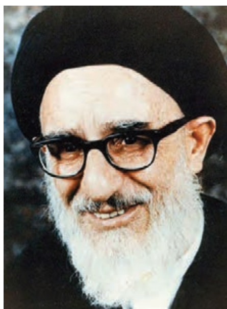
شکل ۱۴-۴- مرحوم آیت‌الله طالقانی