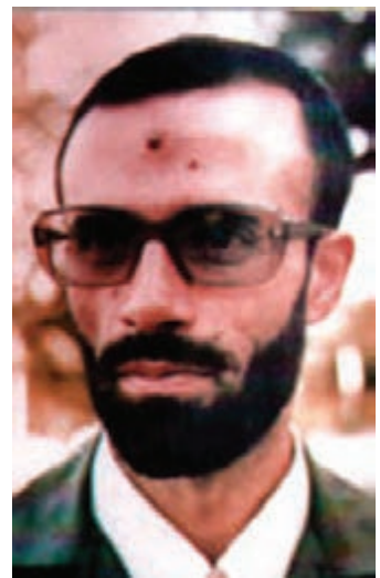
شکل ۸-۴- شهید کلاهدوز