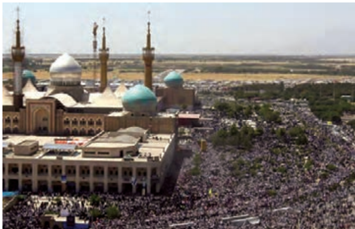
شکل ۱۷-۴- حرم مطهر امام خمینی (قَدَسَ سِرُّهُ)

اکنون نیز جای آن دارد که با پاس داشتن خون شهدای گرانقدر، حفظ دستاوردهای رشادت‌های آن عزیزان و ادامه راه آن‌ها، رضایت خداوند بزرگ را نیز فراهم آوریم.