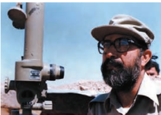
شکل ۱۱-۴- شهید دکتر مصطفی چمران

شخصیت‌های برجسته‌ی زیادی را می‌توان از تهران نام برد که سنگرهای خود را در مجلس شورای اسلامی، مدرسه و ... ترک کردند و به جبهه‌ها شتافتند و به درجه رفیع شهادت نائل آمدند؛ از آن جمله می‌توان شهید مصطفی چمران را نام برد. همچنین از میان سرداران سپاه و ارتش نیز افراد برجسته‌ای بودند که با وجود مسئولیت‌های کلان کشوری، سنگرها را بر صندلی‌ها ترجیح دادند و همچون سایر رزمندگان به خطوط مقدم جبهه رفتند؛ از جمله تیمسار ولی... فلاهی، شهید ستاری، شهید حسن باقری، شهید کلاهدوز و شهید سید مرتضی آوینی (شهید اهل قلم) روایتگر «روایت فتح».