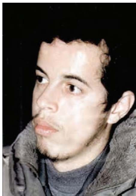
شکل ۱۲-۴- شهید حسن باقری

از روحانیان ممتاز می‌توان از مرحوم آیت‌الله طالقانی یاد کرد. او شکنجه‌های بسیاری در زندان طاغوت کشید و از یاران امام خمینی (ره) و اولین امام جمعه تهران پس از انقلاب بود. آیت‌الله طالقانی شاگردان بسیاری برای مبارزه با رژیم ستم‌شاهی تربیت کرد که شهید چمران یکی از کسانی بود که در مجالس درس ایشان شرکت می‌کرد.