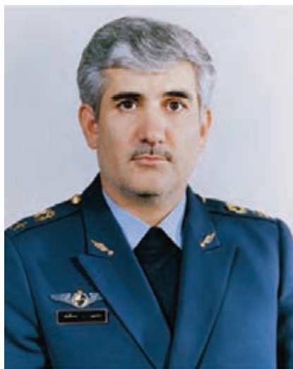
شکل ۹-۴- شهید ستاری