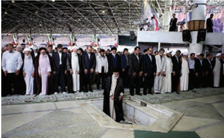
شکل ۱۶-۴- نماز جمعه تهران به امامت حضرت آیت الله خامنه‌ای رهبر معظم انقلاب اسلامی

مردم تهران نه تنها در صحنه دفاع حضور فعال داشتند بلکه با تشکیل ستاد معین بازسازی، همچنان حضور خود را در صحنه حفظ کردند و در زمینه آبادسازی مناطق آزاد شده به خصوص خرمشهر، به تلاش‌های خود ادامه دادند.