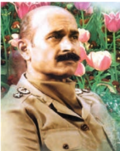
شکل ۱۰-۴- شهید فلاهی

از دیگر کمک‌های مردمی به رزمندگان علاوه بر اهدای کالا، می‌توان به اهدای خون نیز اشاره کرد. مردم هر وقت احساس می‌کردند به خون آن‌ها نیاز است، دریغ نمی‌کردند. همچنین، آنان با شرکت فعال در راهپیمایی‌ها به مناسبت‌های مختلف، به رغم بمدگداری‌ها و حملات هوایی دشمن، موجب تقویت روحیه رزمندگان می‌شدند و دشمنان را مأیوس می‌کردند.