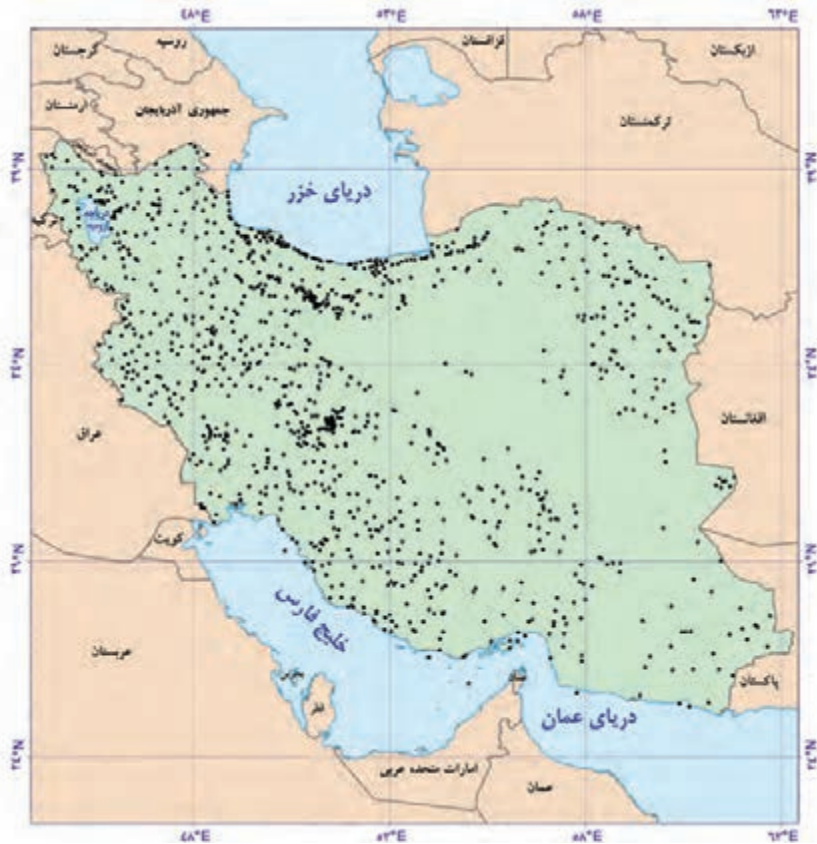
شکل ۳- نقشه پراکندگی نقاط شهری ایران بر حسب عرض جغرافیایی