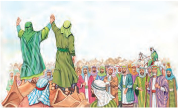
○ اجتماع غدیر خم

حضرت محمد ﷺ بر پایه تعالیم اسلام، نظام اجتماعی و حکومت جدیدی را بنیان نهاد که بر همکاری زمامداران و مردم استوار بود. آن حضرت از اصل مشورت برای مشارکت دادن مردم در امور حکومت به خوبی بهره می‌گرفت و پس از مشورت با اصحاب اقدام به تصمیم‌گیری در مسائل مهم سیاسی و نظامی می‌کرد. برای مثال در جنگ اُحد رأی جوانان را که اکثریت داشتند بر رأی خود ترجیح داد و در جنگ خندق، پیشنهاد سلمان فارسی را در کندن خندق و شیوه دفاع از شهر پذیرفت.